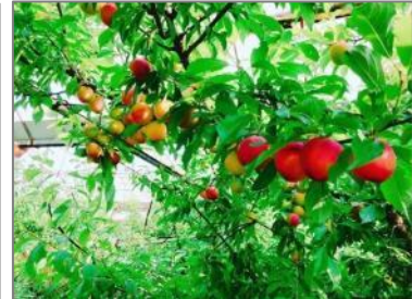
ハーティープラム