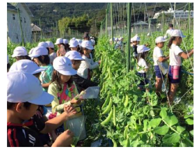
スナップエンドウ畑