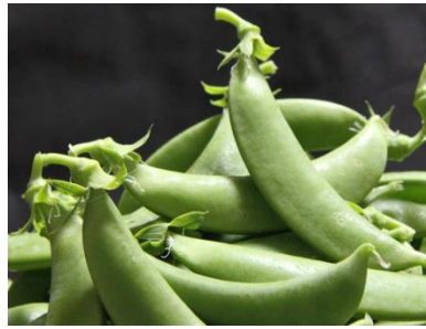
スナップエンドウ