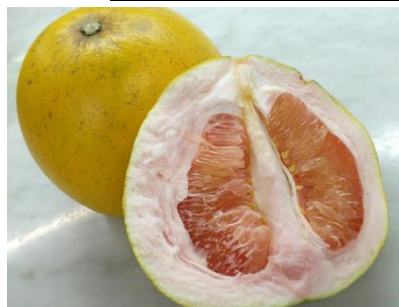
紅文旦（チャンドラポメロ）